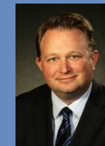
Professor für Öffentliches Recht und Kommunalwissenschaften

Direktor des Instituts für Bürgerbeteiligung und Direkte Demokratie