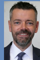
Professor für Kommunalrecht