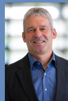
Professor für Betriebs- und Finanzwirtschaft